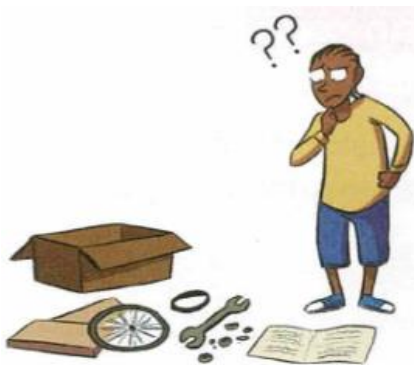
Je ne sais pas faire