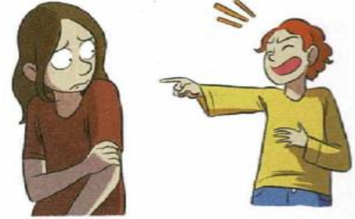
On se moque de moi