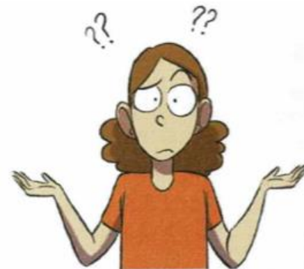
Je ne comprends pas