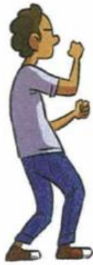
Je me bagarre