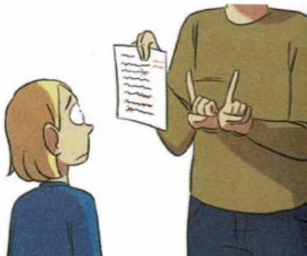
Je me suis trompé