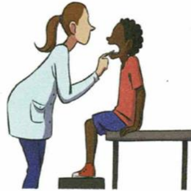
Je suis malade