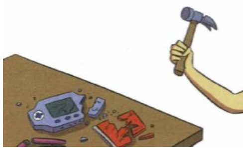
On me casse mes affaires