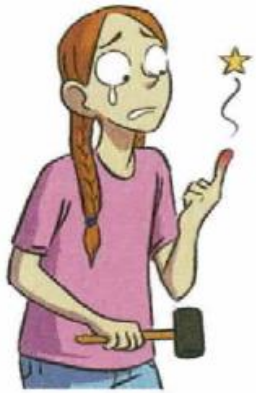
Je me suis fait mal